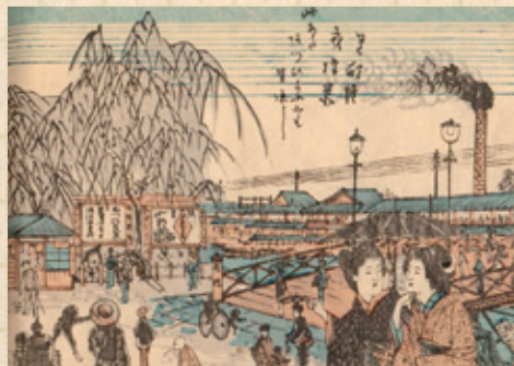
(C)「大阪案内」より「道頓堀戎橋景」 多くの名所図を描いた広瀬春孝作(大阪市立中央図書館所蔵)

明治11年(1878)、戎橋は木橋から鉄橋に架け替えられました。長さは39.8m、幅は7.8m。欄干はX状に組んだ鉄材が用いられていました。