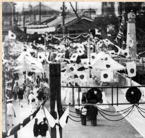
(A) 大正14年、晴れがましく行われた戎橋の渡り初め

大正14年(1925)、戎橋は橋梁耐震化事業によって石・コンクリート橋へと架け替えられました。長さ36.1m、幅10.9m、総費用は5万円。第7代大阪市長・関一の下で第2次市域拡張が行われて、大阪が「大大阪」となった年でもあります。優美なアーチ型デザイン、橋全体は花崗岩によって化粧された美しさは、モダニズム時代のミナミを象徴していました。戎橋の渡り初めでは、橋が末永く親まれることを祈って、南から北へ親子3代夫婦が渡りました(A)。