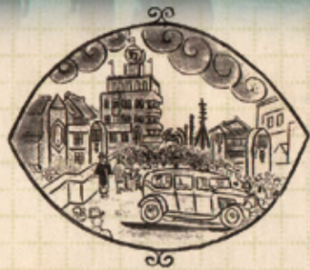
(B') 小出権重が描いた谷崎潤一郎作『蓼食う虫』の挿絵

(B)は戎橋北詰から南を望んだ写真です。左右に完成直後の松竹座・丸万ビル、中央には戎橋とそれに続く戎橋筋商店街が配された印象的な1枚です。このアングルは、大阪を代表する洋画家・小出権重が描いた谷崎潤一郎の小説『蓼食う虫』の挿絵にも登場します(B')。