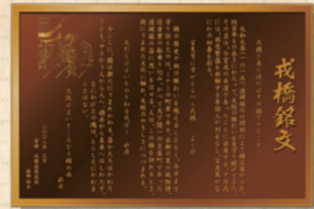
(D) 平成の架け替えを機に、橋詰に設置された銘板