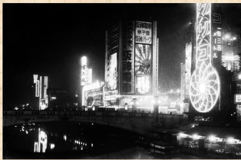
(C) 昭和初めの戎橋。現在も道頓堀の名物「グリコ」のネオンは初代のもの。イルミネーションが道頓堀の川面に揺れている

昭和12年(1937)、「大阪の大動脈」御堂筋が完成しました。(C)は道頓堀に架かる御堂筋の橋・道頓堀橋<11年(1936)完成>から戎橋を望んだ写真です。右側に道頓堀名物のグリコのネオンサイン(初代)が写っています。「赤い灯、青い灯」と歌われた道頓堀のイルミネーションですが、「道頓堀行進曲」が流行した3年(1928)当時は、電球に色を塗った「着色電球」でした。10年(1935)頃になると、次第にネオン管が普及するようになります。しかし戦争が始まり、14年(1939)には戦時市民生活運動の中で贅沢品として禁止されてしまいます。