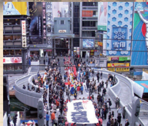
(C) 平成19年、架け替えられた戎橋

平成19年(2007)11月22日、「平成の戎橋」として架け替えられた戎橋は、新たな生命を吹き込まれて現代によみがえりました。長さ26.0m、幅11.0mで、中央部分に18.0mの円形の膨らみ(広場)が設けられました。これは街と街、人と人をつなぐ、橋渡しをすると共に、末永く「集いの場」として親しま