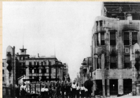
(A) 大阪大空襲後の戎橋。橋は焼失を免れたものの、周辺は甚大な被害を受けた

第2次世界大戦によって、道頓堀に架かる橋のいくつかは焼け落ちてしまいます。しかし戎橋は石橋であったため、焼失を免れました。(A)は空襲後、戎橋南詰から北を望んだ写真です。心齋橋筋商店街の西側には小倉屋のオグラビル、奥には大丸百貨店が、右側(東側)には南海食堂ビルが写っています。