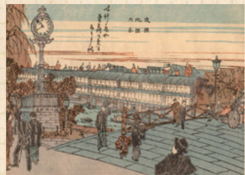
(D)「大阪案内」より「戎橋北詰乃図」 対岸の道頓堀には、芝居小屋が賑わいを見せている

もう1つは、戎橋北詰の宗右衛門町から南東を望んだ絵(D)です。ガス灯と共に北東角にあった渋谷時計店の時計台が、ハイカラの象徴として描かれています。南詰には「いろは茶屋」と呼ばれた道頓堀の芝居茶屋街、その奥に芝居小屋の幟がひしめき合っています。