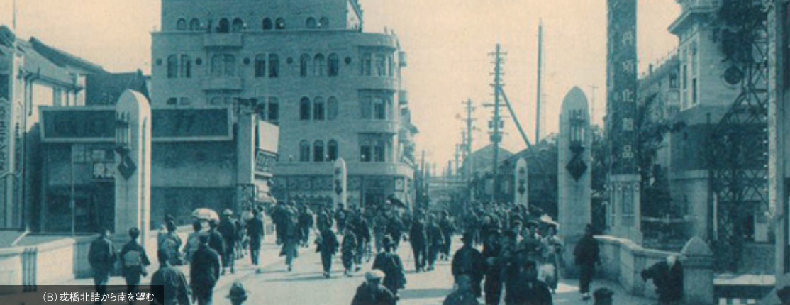
(B) 戎橋北詰から南を望む