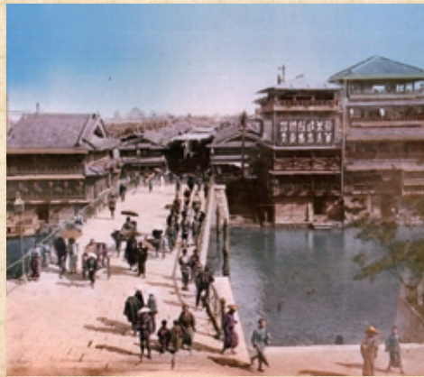
(B)戎橋北詰の奥には心齋橋商店街の日覆いが続く

鉄橋時代の戎橋の姿を写した貴重な写真が2点。(A)は道頓堀北岸の久左衛門町から東を望んだ写真。左手の戎橋北詰に丸万北店(うどん屋)の幟が写っています。(B)は現在のTSUTAYA辺りから北を望んだ写真です。心齋橋筋商店街には日覆い(アーケード)が設置されているのが分かります。