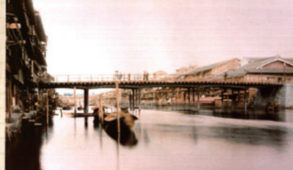
(A)鉄橋の戎橋

明治20年代に出版された『大阪案内』には、鉄橋時代の戎橋を描いた絵が2点掲載されています。1つは戎橋南詰東(現在のかに道楽)から北西を望んだ絵(C)です。南詰には人力車の寄せ場と交番が描かれ、北詰には丸万北店の煙突が描かれています。