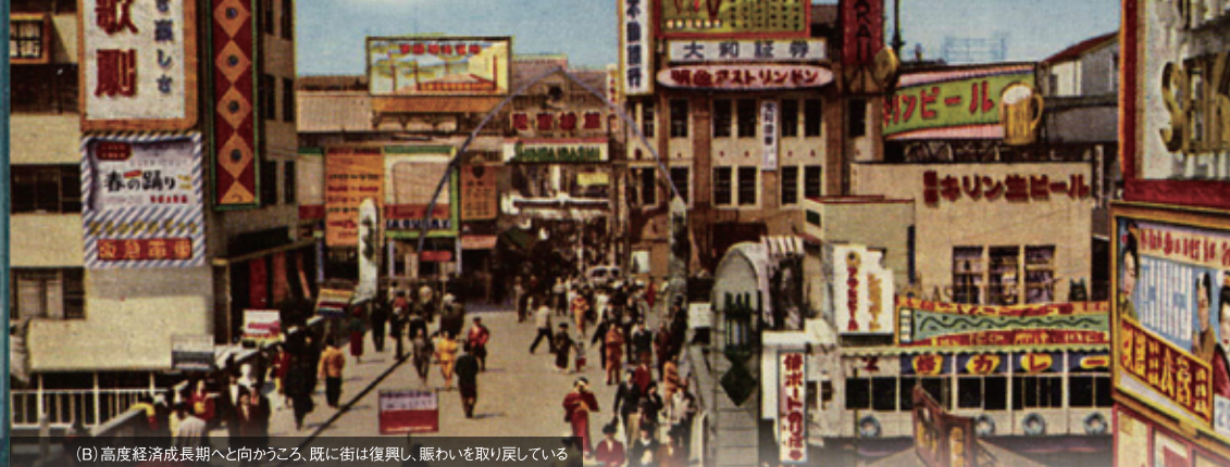
(B) 高度経済成長期へと向かうころ、既に街は復興し、賑わいを取り戻している