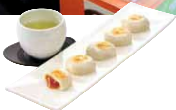
「みたらし小餅」1箱(12ヶ入り)650円(税込)