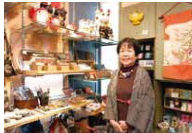
館内には素敵な小物が多彩に。