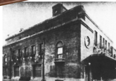
1897年当時の「南地演舞場」