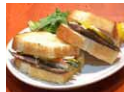
2階ではこだわりの味が楽しめる