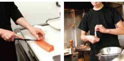
季節限定コースと鍋は全7コース、4,000円(飲み放題付き)より。一品料理も150種類以上、380円より。