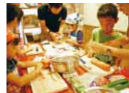
「子どもカフェ」は毎月開催される

営業時間 1階/10時～23時 年中無休 2階/11時～23時 月曜定休 tel.06-6641-3261