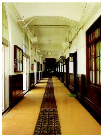
体験講座会場の元精華小学校