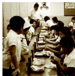
「精華小学校122年の歩み」より

海外では、使わなくなったおもちゃを子どもたちどうして売るフリーマーケットがあるそうです。モノの価値やお金の意味を自分で考え、学べる機会となっています。昔、元精華小学校にも「こども銀行」がありました(写真)。