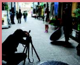
2010年春に実施した変身体験の様子