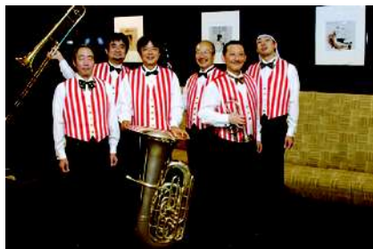
Southside Jazz Band

毎年秋（今年は10月30日・31日）精華小劇場を中心に、ジャズの都ミナミの創出を願い、ミナミ・ジャズ・ウォーク2010が開催されます。今回はそのイベントとして、ジャズが初めての方でも楽しめるように、ニューオーリンズに生まれ海を渡って日本に上陸、道頓堀で一世を風靡したジャズの足跡を追い、スタンダードなナンバーを中心にお楽しみいただけます。