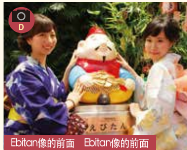
Ebitan像的前面 Ebitan像的前面

■2014年重新装修 曾入选 good design 大奖, 照片纳入拱廊集。夜晚点灯。 ■2014年整修完畢, 曾獲日本設計賞。來這裡, 白天可以拍攝整潔明亮的商店街與入口大門, 即使到了夜晚也是燈火通明。