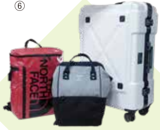
MAP-18 Jaguar Kaban TAXI 銀

行李箱，拉杆箱常有200多个。PORTER, THE NORTH FACE, anello等名牌产品应有尽有。