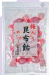
MAP-13 Oguraya 銀