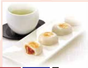
MAP-24 Chidoriya 銀