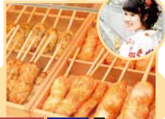
MAP-21 Daitora 銀