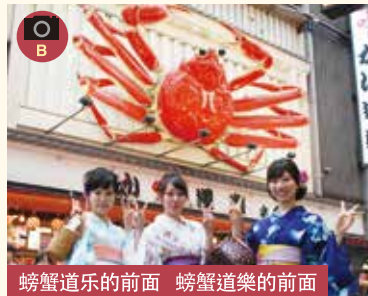
螃蟹道乐的前面 螃蟹道樂的前面

■大阪有名的格力的招牌做一样的姿势来拍照 ■大阪有名的格力的招牌做一样的姿势来拍照