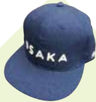
MAP-15 SHOP MU 銀