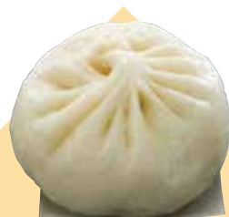
MAP-08 551 Horai 銀

猪肉和洋葱的手包馒头是551店的最热门商品！ 猪肉和洋葱的手包馒头是551店的最熱門商品！