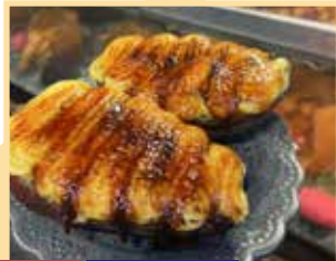
MAP-17 3-star sweets