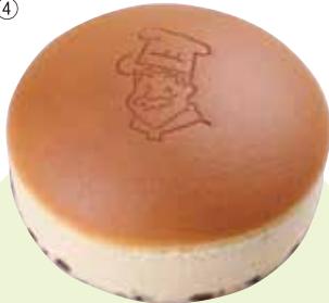
MAP-06 Rikuro Ojisan's Shop

为您准备了超人气芝士蛋糕。 直接於店內設置烤爐，以隨時提供剛出爐的高人氣起司蛋糕。