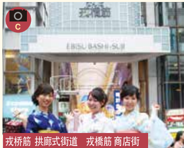
戎桥筋 拱廊式街道 戎橋筋 商店街

■2014年重新装修 曾入选 good design 大奖, 照片纳入拱廊集。夜晚点灯。 ■2014年整修完畢, 曾獲日本設計賞。來這裡, 白天可以拍攝整潔明亮的商店街與入口大門, 即使到了夜晚也是燈火通明。