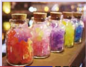
MAP-04 Ichibirian TAXI 銀