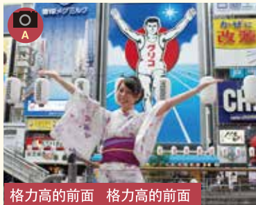
格力的前面 格力的前面

■大阪有名的格力的招牌做一样的姿势来拍照 ■大阪有名的格力的招牌做一样的姿势来拍照