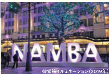
御堂筋イルミネーション(2019年)