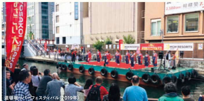
道頓堀リバーフェスティバル(2019年)