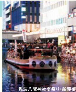
難波八阪神社夏祭り・船渡御

ミナミにゆかりのある神社・お寺の伝統的で個性豊かな夏祭りを楽しめます。生國玉神社・いくたま夏祭／難波八阪神社夏祭り・船渡御・陸渡御／御津八幡宮夏祭／浪速・高津宮大祭／難波神社・氷室祭／今宮戎こどもえびす