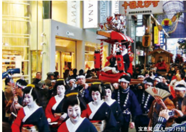
宝恵駕(ほえかご)行列

御堂筋イルミネーションとともにミナミ各地の商業施設にイルミネーション・オブジェが飾られます。