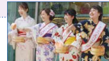
衣装提供:なんばマルイ