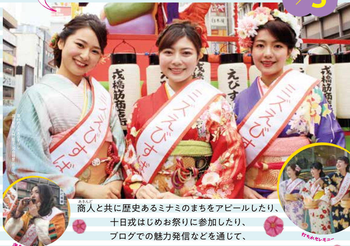
高24代(2019年)から 高25代(2020年)まで 高26代(2021年)まで