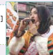
海苔のキャンペーン

海苔のキャンペーン[例年1月末(日曜日)の午前中] ★巻き寿司丸かぶりコンテスト出演