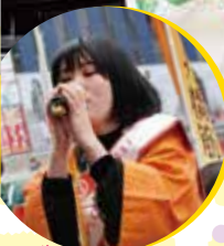
海苔キャンペーン