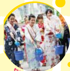
打ち水セレモニー