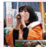
海苔のキャンペーン

海苔のキャンペーン [例年1月末(日曜日)の午前中] ★巻き寿司丸かぶりコンテスト出演