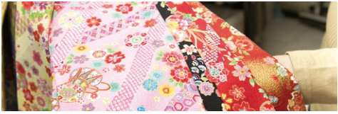
エンボスと柄プリント(1m) ¥500

高島屋大阪店 06-6631-1101 / 10:00~20:00(週末(金・土)は20:30まで)