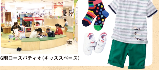
6階ローズパティオ(キッズスペース)

見てるだけで心が浮き立つ、「カラフルグラフィカルスタイル」がトレンド。弾けるような明るいカラーリングに柄を掛け合わせた、春夏スタイリングをご提案します。