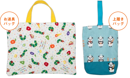
(サンプル) ※グッズ見本です。同じ柄の生地はありませんのでご了承ください。